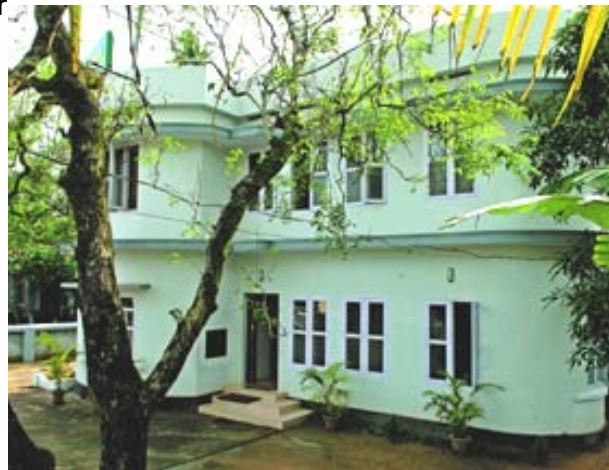
3 Wochen BZ 2600 EUR/Person in Kerala, Europa