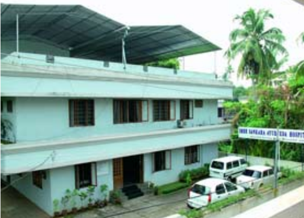
3 Wochen BZ 2600 EUR/Person in Kerala, Europa