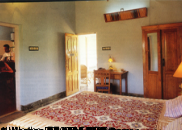
3 Wochen BZ 2300 EUR/Person in Kerala, Europa